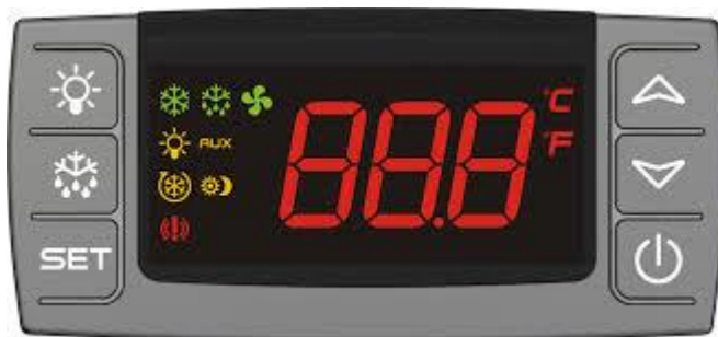
* On/off knapp