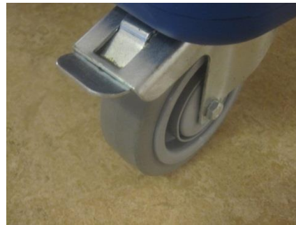
Bromsen i öppet läge.