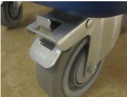
Bromsen i låst läge.